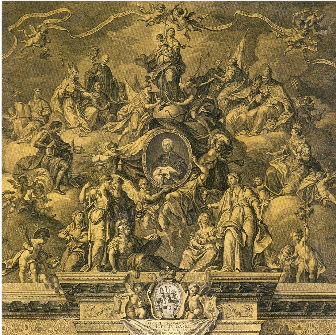
Grosser Wandkalender der Diözese und des Fürstbistums Basel (Ausschnitt, oberer Teil) 1779 (1786).